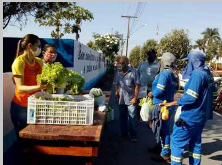
Distribuição de verduras para famílias de Turvelândia

De acordo com o prefeito Siron Queiroz, a ação visa ajudar as famílias a enfrentarem as dificuldades provocadas pela pandemia e leva mais qualidade de vida a todos.