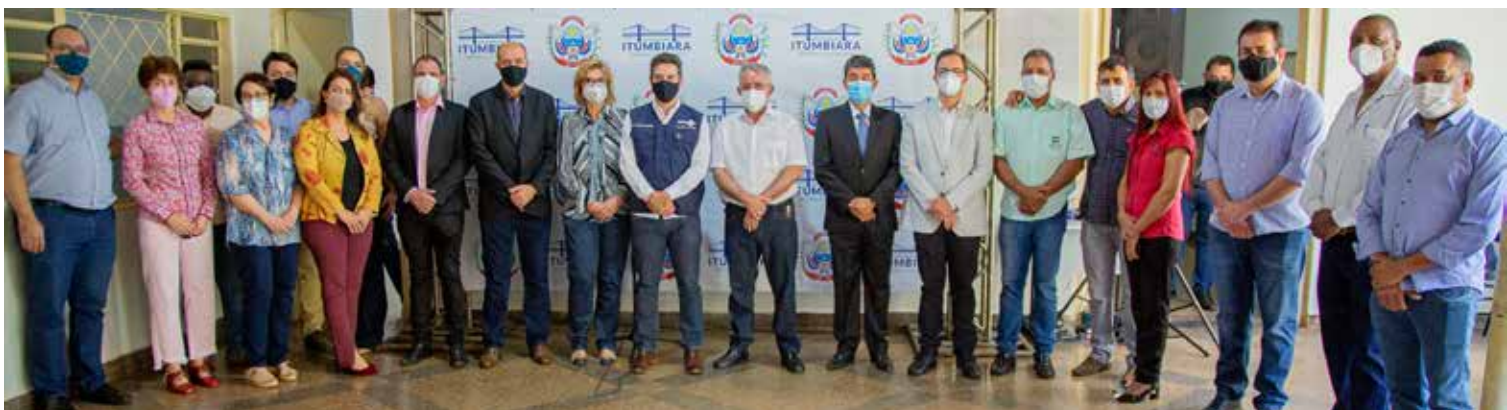
Corte da fita de descerramento das placas de inauguração do CAPS