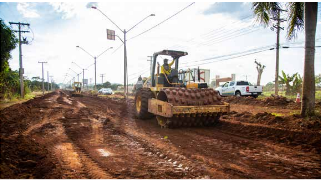
Máquinas trabalhando na revitalização da Av. Modesto de Carvalho